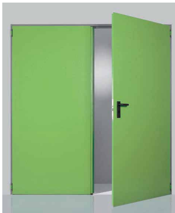
Porta a due ante