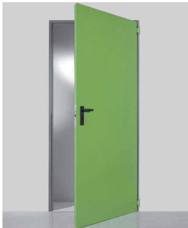
Porta ad un'anta

*escluso in combinazione con vari Optional